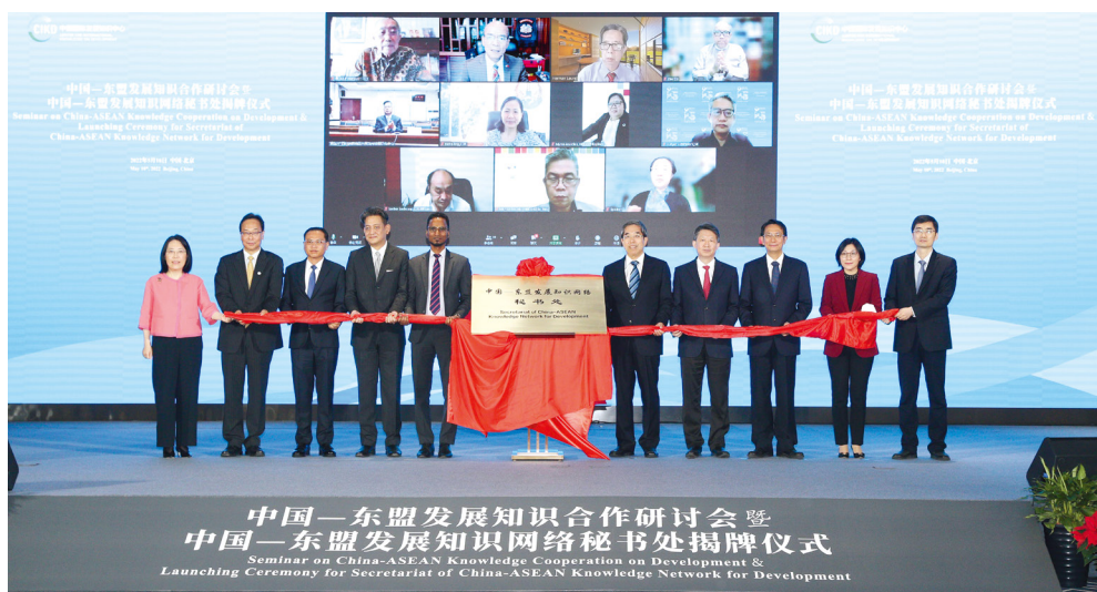
中国—东盟发展知识网络秘书处揭牌

则、实施路径和早期收获的研究，就构建全球发展共同体提出政策建议，受到国际知识界广泛关注。发布《全球发展报告》是中方落实全球发展倡议的一项重要举措，致力于为各国发展提供有益借鉴，为全球发展事业提供智力支持。第二期报告将聚焦“处在历史十字路口的全球发展”，将于2023年9月发布。