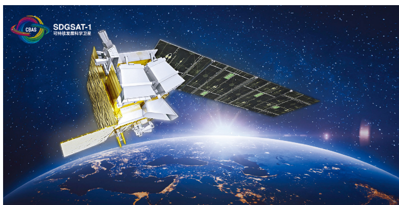
可持续发展科学卫星 1 号

2021 年 11 月 5 日，中国在太原卫星发射中心成功发射可持续发展科学卫星 1 号 (SDGSAT-1)。SDGSAT-1 是全球首颗专门服务 2030 年议程的科学卫星。SDGSAT-1 卫星搭载了热红外、微光和多波段成像仪，通过三个载荷全天时协同观测，旨在实现“人类活动痕迹”的精细刻画，为表征人与自然交互作用的指标研究提供支撑，服务全球可持续发展目标的实现。