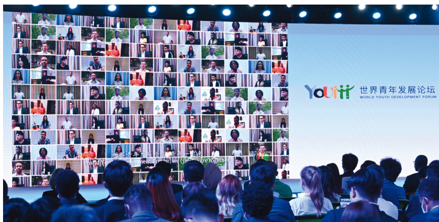
世界青年发展论坛现场