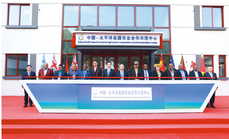
中国—太平洋岛国农业合作示范中心启用仪式