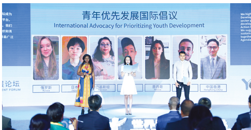
与会青年代表共同起草并一致通过《青年优先发展国际倡议》

州宣言》，呼吁深化数据创新和伙伴关系，完善数据治理，促进数据包容开放，为推动全球可持续发展注入新的活力。