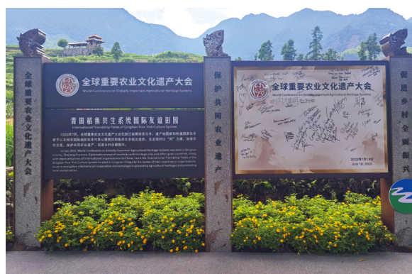
全球重要农业文化遗产大会各国代表签名

产大会”在浙江青田成功举办。28个国家和国际组织支持发起“农耕文明保护倡议”，呼吁坚持保护优先，进一步提升国际社会对农业文化遗产的认知和保护意识，充分发挥农业文化遗产在保障粮食安全、适应气候变化、保护生物多样性和生态系统等方面的作用，深化互鉴合作，加强政策支持，关注小农生计，促进乡村发展，推动多方参与，助力联合国2030年可持续发展目标实现。