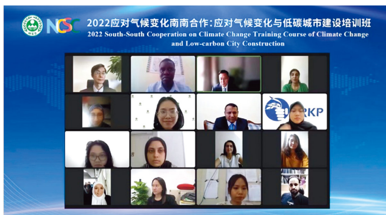
南南合作应对气候变化与低碳城市建设培训班

近年来，全球极端气候导致的自然灾害频发，生物多样性丧失速度加快，人与自然和谐相处面临严峻挑战。人与自然是生命共同体，生态兴则文明兴。全球发展倡议坚持人与自然和谐共生、行动导向的理念，推动加强南南合作、搭建交流对话平台、促进生产生活方式改变，推动实现更加强劲、绿色、健康的全球发展。