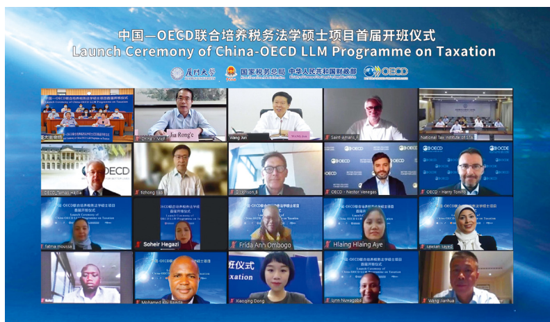
“中国—OECD 联合培养税务法学硕士项目” 首届开班仪式

加强税收征管和反腐败合作，帮助发展中国家充分挖掘利用国内资源。 税收监管和反腐败治理能力关系到发展中国家财政可持续性。中国借助国际组织平台，通过举办培训、联合办学、研讨交流、信息共享等方式，积极帮助有需求的其他发展中国家提高税收征管能力，推进税收治理体系和治理能力现代化。借助OECD—中国国家税务总局多边税务中心等平