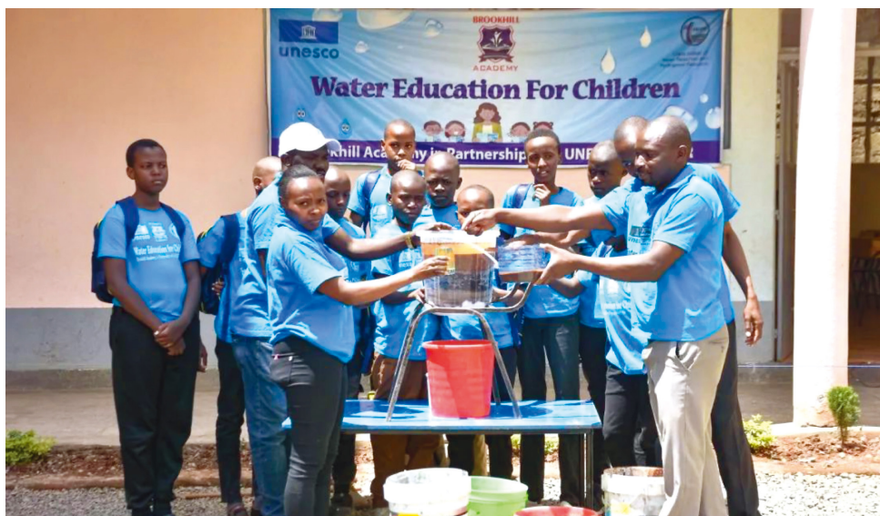
内罗毕布鲁克希尔师生动手制作污水过滤器