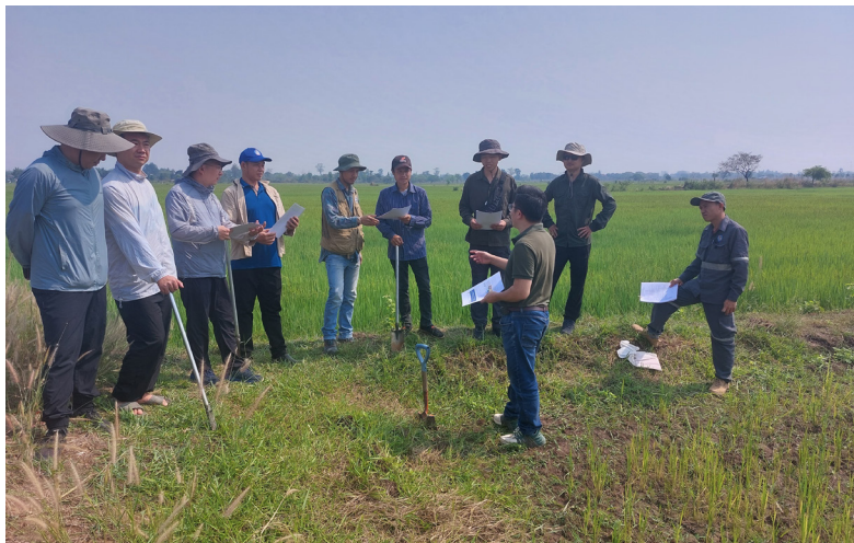
老挝绿色土地地球化学调查野外培训

物、农机装备、农产品精深加工以及专业技术人才培养等需求，联合开展农业生产技术创新、先进适用农业生产技术培训。此外，中国还通过帮助其他发展中国家编制水利领域规划，提供水利技术人员和官员培训，开展流域管理与生态修复、农村水利与粮食安全等领域合作，提供突发水情通报、防灾减灾技术援助等方式，帮助提升发展中国家的水利发展水平。